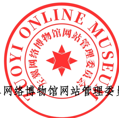
左翼网络博物馆网站管理委员会