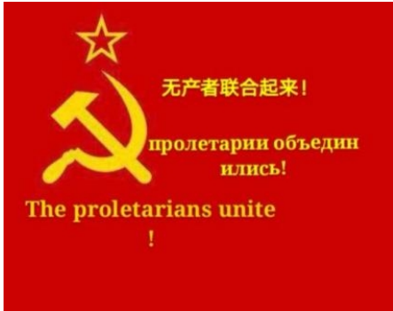
网络左翼第一国际