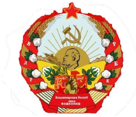
弗拉基米尔第一共和国

2021年11月，“弗拉基米尔第二共和国”改组为“波尔维勒第一共和国(bewl.site)，西班牙语“波尔维勒”意为“人民”。并宣布“弗拉基米尔苏维埃共和国”群聊非法，2022年2月，“弗拉基米尔苏维埃共和国”宣布解散，人员合并成立“波尔维勒共和国(第二共和国)(bewl-2014.top)”。