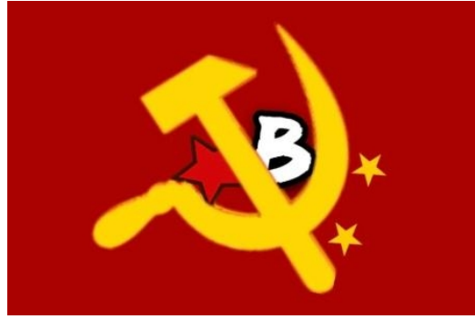
网络左翼第二国际