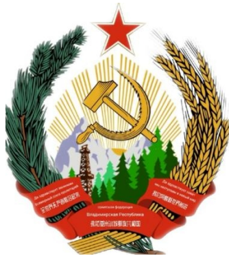
弗拉基米尔苏维埃共和国