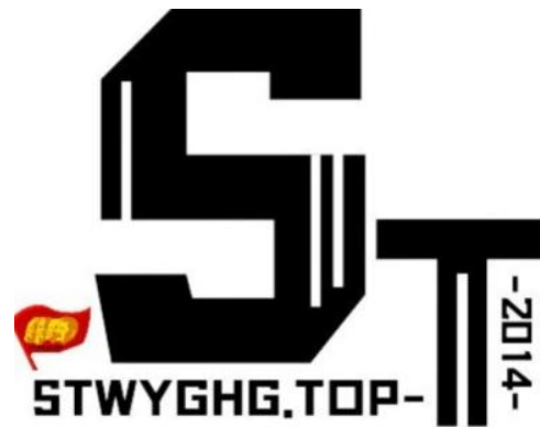
斯特维亚网络交流论坛