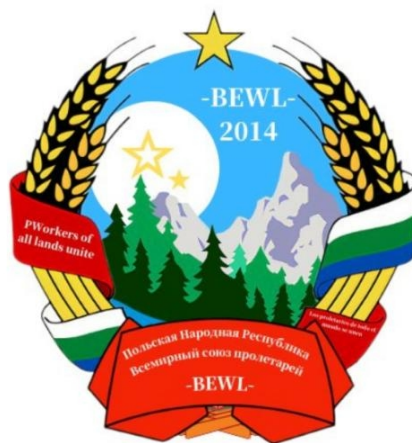
波尔维勒第二共和国