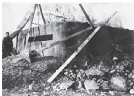
Бетонированный КП немцев береговой батареи в Лиинахамари

Особое внимание советское командование уделяло десанту в Лиинахамари. Этот порт был одной из важнейших военно-морских баз немецкого флота на побережье Баренцева моря и главным перевалочным пунктом для вывоза никеля из месторождений в районе Петсамо. К тому же здесь проходил один из рубежей немецкой обороны на пути советских войск в Норвегию. Этот опорный пункт противника необходимо было быстро взять, чтобы не было задержек в общем наступлении Карельского фронта.