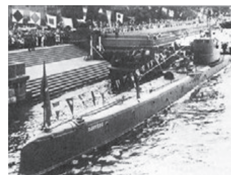
«Пантера» на военноморском параде в Ленинграде

на зимовке в Ревеле, активно участвовал в массовых манифестациях рабочих, солдат и матросов, в митингах на улицах города. После Великой Октябрьской социалистической революции, когда над кораблями Балтфлота нависла угроза захвата германскими войсками, подводная лодка участвовала в легендарном «Ледовом походе» Балтийского флота и в феврале 1918 г. в крайне сложных ледовых условиях прорвалась из Ревеля в Гельсингфорс, а оттуда в апреле совершила переход в Кронштадт. Участвовала в боях с белофиннами на Ладоге. В марте 1919 г. включена в состав Действующего отряда БФ (ДОТ), который защищал морские подступы к Петрограду, о чем уже было сказано выше.