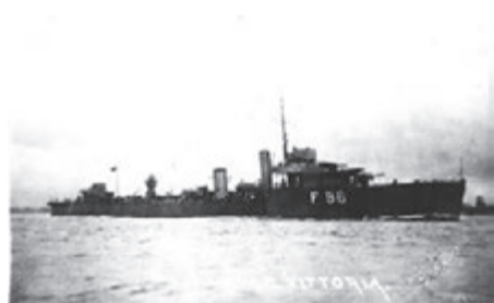
Английский эсминец «Виттория»

На рассвете 31 августа 1919 г. подводная лодка «Пантера» вышла из Кронштадта в крейсерство в район Копорского залива – Койвисто (Бьёрке) с целью поиска и уничтожения английских кораблей. В тот же день, командир обнаружил в перископ несколько английских эсминцев, два из которых позже встали на якорь восточнее о. Сейскари. В 19 час.15 мин.командир принял решение атаковать противника со стороны заходящего солнца, а в 21 час 16 мин с дистанции 4-5 каб. «Пантера» вышла в атаку, произведя двухторпедный залп, выпустив торпеды из правого и левого носовых торпедных аппаратов. Первая торпеда прошла мимо эсминца, вторая попала в борт английского корабля. На лодке был слышен сильный взрыв и артиллерийские залпы противника. Корабль интервентов окутался дымом и ушел на дно. Так был потоплен один из новейших и совершенных кораблей в мире – английский эсминец «Виттория» (водоизмещение 1365 тонн, скорость 34 узла). Поскольку атака была произведена на малых глубинах (ок. 20 м), «Пантера», сделав крутой поворот на северо-восток ушла сначала на большие глубины, а потом перешла в подводном положении к маяку Шепелевский, отлежалась на грунте, дожидаясь светлого времени суток для уточнения своего места.