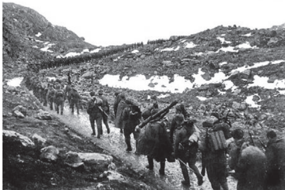
Наступающая Красная Армия

Согласно докладу Сталина, в результате десяти вышеперечисленных операций войска Германии и её союзников потеряли до 120 дивизий, что составляло почти половину от всех вражеских войск, стояв-