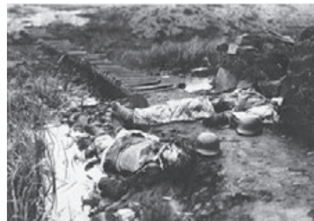
Убитые немецкие горные егеря

Оборона Никеля была возложена на группу войск генерал-лейтенанта Э. Фогеля, состоявшую из частей и подразделений, отступивших от Луостари и перебазировавшихся из Финляндии. К 21 октября войска 14-й армии вышли на государственную границу СССР, а 22 октября частями 127-го корпуса и 31-го корпуса под командованием генерал-майора М.А. Абсалюмова были освобождены посёлок Никель и район никелевых разработок.