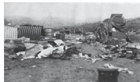
Брошенный немцами обоз

Яр-фьорд был форсирован на амфибиях, плашкоутах, подготовленных Инженерными войсками флота и рыбацких лодках. Большую помощь оказали бойцам норвежские патриоты, вышедшие в море на двух мотоботах. Они спасали экипажи подбитых амфибий и, несмотря на обстрел, переправляли их на другой берег. Когда затем при форсировании Эльвенес-фьорда пришлось начинать все сначала и 14-я дивизия наводила десантную переправу на плотках, местные жители снова оказали поддержку советской армии. Так же поступали в Бек-фьорде.