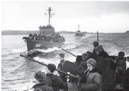
Корабли Северного флота с десантом на пути к г. Петсамо

молётов). В операции также участвовал Северный флот (командующий адмирал Арсений Головкин) : свыше 20 тыс. человек, более 250 кораблей и судов, 276 самолетов морской авиации. Непосредственно в операции участвовало 2 бригады морской пехоты, отряды кораблей (6 эсминцев, 8 подводных лодок, более 40 торпедных катеров и охотников).